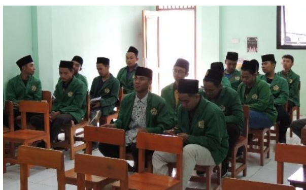
Gambar 1. Santri Pondok Pesantren Nurul Ikhlas Sidoarjo

Aplikasi Profits Anywhere dirancang dengan tujuan untuk mempermudah para investor untuk menjual atau membeli saham, sehingga memungkinkan untuk membaca dan menganalisis harga saham sebelum mereka membelinya. Hasil observasi menunjukkan bahwa santri pada Pondok Pesantren Nurul Ikhlas Sidoarjo masih asing dengan kata investasi, dan sebelumnya juga belum mengenal aplikasi jual beli saham, para santri telah dibekali dengan pelatihan terkait apa itu investasi dan bagaimana cara berinvestasi dengan aman, setelah mengetahui hasil tersebut kemudian dilakukan tindakan lanjutan yaitu sosialisasi penggunaan aplikasi jual beli saham untuk memudahkan mereka dalam melihat harga saham