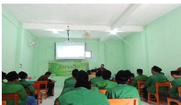
Gambar 2. Sosialisasi Pemanfaatan Aplikasi Profits Anywhere

Hasil dari observasi menunjukkan bahwa sebagian Santri di Pondok Pesantren Nurul Ikhlas Sidoarjo menyadari pentingnya pengelolaan uang melalui investasi. Oleh karena itu pemanfaatan aplikasi jual beli saham ini dipergunakan untuk mempermudah para santri dalam melihat harga saham, membeli, maupun menjual saham mereka. Dari observasi yang telah dilaksanakan, kemudian menentukan rencana target peserta yang berjumlah 50 orang, kegiatan ini dilaksanakan (2 hari), tentukan lokasi kegiatan serta buat rencana anggaran yang akan digunakan. Jual beli saham kini bisa diakses secara online hanya dengan aplikasi saja. Salah satu aplikasinya yaitu aplikasi Profits Anywhere . Profits Anywhere merupakan aplikasi untuk jual beli saham berbasis digital, adanya Profits Anywhere juga membantu masyarakat melihat harga saham yang terbaru dan mereka bisa memantau hanya dengan aplikasi ini. Di sela-sela sosialisasi, peserta akan diberikan beberapa pertanyaan berkaitan dengan materi yang sudah diberikan. Pada awal kegiatan ini banyak santri serta santriwati yang belum mengetahui aplikasi Profits Anywhere , selain itu santri serta santriwati juga masih belum tau bagaimana cara penggunaan aplikasi Profits Anywhere .