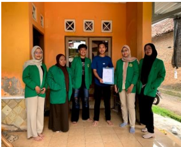
Gambar 2. Penyerahan NIB

memanfaatkan legalitas tersebut untuk pengembangan usaha. Dibawah ini terlampir dokumentasi Penyerahan NIB sebagai bentuk tahapan akhir pendampingan legalitas usaha melalui sistem OSS yang menyatakan Warung Shasena telah resmi diakui oleh pemerintah.