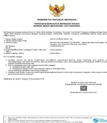
Gambar 3. Bukti Dokumen NIB

Pelaksanaan tahap ini sangat penting agar pelaku UMKM benar-benar mengerti manfaat NIB serta dapat menggunakan dokumen itu untuk mendapatkan akses permodalan, mengikuti program pembinaan dari pemerintah, dan meningkatkan kepercayaan konsumen.