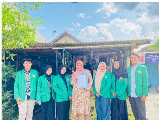
Gambar 4. Penyerahan Bukti Penerbitan NIB

Secara keseluruhan, pendampingan ini menunjukkan bahwa literasi digital dan pemahaman legalitas adalah dua aspek yang sangat berpengaruh terhadap kemampuan UMKM dalam mengurus perizinan. Kegiatan ini membuktikan bahwa dengan pendekatan yang tepat, pendampingan langsung, dan penjelasan yang mudah dipahami, pelaku UMKM dapat menyelesaikan proses legalisasi usaha dengan baik. Proses ini juga memberikan nilai edukatif jangka panjang karena pemilik UMKM menjadi lebih siap menghadapi kebutuhan administratif di masa mendatang. Oleh karena itu, pendampingan seperti ini perlu terus dilakukan agar semakin banyak UMKM kecil dapat berkembang dan beroperasi secara legal sesuai dengan standar perizinan yang berlaku. Berikut kami tampilkan foto penyerahan bukti penerbitan NIB kepada pemilik UMKM Mie Cot Spesial Mie Pedas.