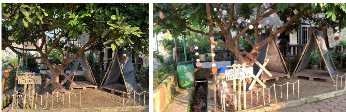
Gambar 2. Taman Bermain

Agar dampak positif dari kegiatan ini dapat berkelanjutan, disarankan agar masyarakat, khususnya perangkat desa dan karang taruna, menjadikan permainan tradisional sebagai agenda rutin dalam kegiatan desa maupun komunitas anak-anak. Orang tua juga diharapkan lebih aktif mendampingi anak saat bermain, sehingga interaksi sosial dan nilai edukatif dapat terus terjaga. Selain itu, sekolah dan lembaga pendidikan setempat dapat mengintegrasikan permainan tradisional dalam kegiatan ekstrakurikuler untuk memperluas manfaatnya. Mahasiswa maupun pihak akademisi diharapkan dapat melakukan penelitian lanjutan guna mengevaluasi efektivitas permainan tradisional terhadap aspek perkembangan anak. Dengan adanya tindak lanjut yang konsisten, permainan tradisional akan tetap lestari dan mampu menjadi benteng budaya sekaligus sarana edukasi yang bermanfaat bagi generasi muda.