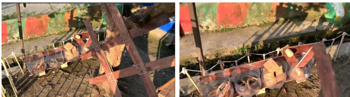
Gambar 3. Permainan Tradisional