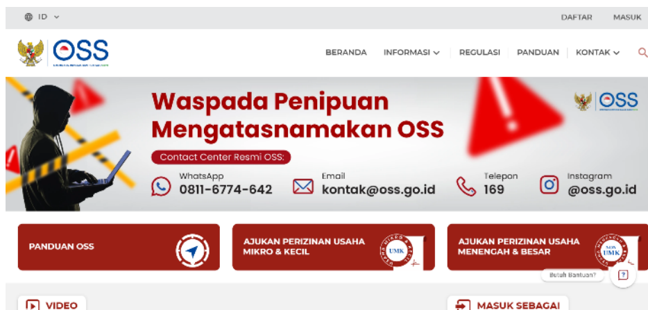
Gambar 1. Tampilan Beranda Situs Resmi OSS

Tahapan selanjutnya ialah menyiapkan seluruh persyaratan administratif secara rinci serta akurat. Dokumen yang harus disiapkan mencakup identitas pribadi (NIK), alamat email aktif, nomor telepon yang masih digunakan, serta data pokok mengenai usaha seperti nama serta alamat usaha, jenis kegiatan usaha, estimasi omzet, jumlah tenaga kerja, serta besaran modal awal. Seluruh data ini akan dihimpun serta tercantum dalam dokumen resmi NIB. Sesuai dengan hasil studi Kurniawan (2024), salah satu hambatan utama dalam proses pengajuan NIB oleh UMKM ialah kurangnya pemahaman terhadap jenis dokumen yang diperlukan untuk mendaftar melalui OSS.