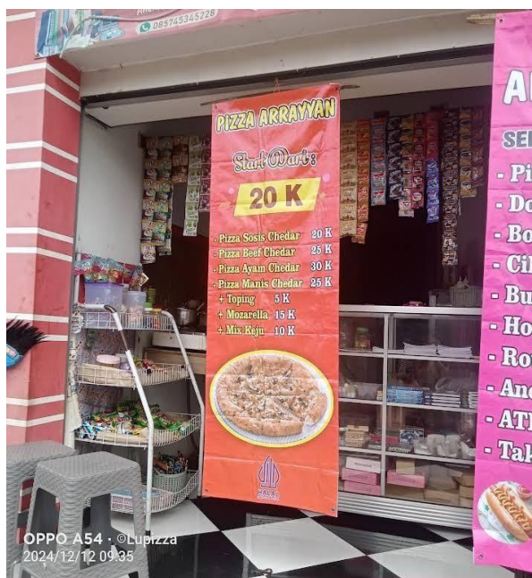
Gambar 2. Tempat Usaha