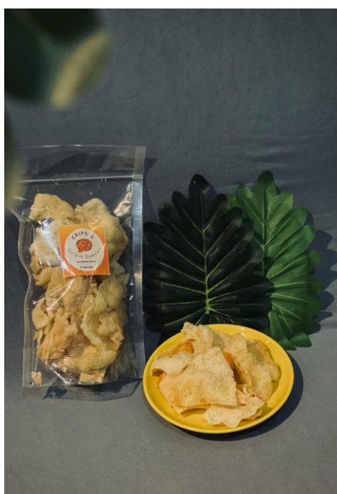
Gambar 1. Foto Produk

Tahap akhir adalah penyerahan dokumen NIB oleh mahasiswa kepada pelaku UMKM. Dalam momen ini, mahasiswa juga memberikan panduan ulang mengenai akses OSS secara mandiri. Penyerahan dilakukan langsung dalam bentuk sertifikat NIB, disertai penjelasan fungsi dan manfaatnya bagi pengembangan usaha (Furuhita et al., 2023).