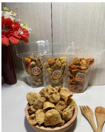
Gambar 2. Produk Keripik Tahu Walik