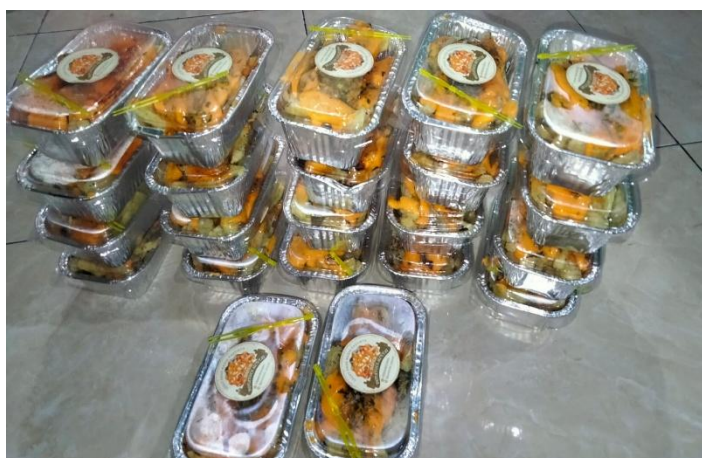
Gambar 3. Produk Pembuatan NIB Pada UMKM Potatoes Mentai