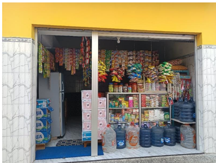
Gambar 3. Toko Kelontong Bu Yuli Astutik