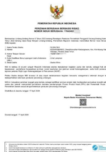
Gambar 3. Dokumentasi Penyerahan Nomor Induk Berusaha (NIB)