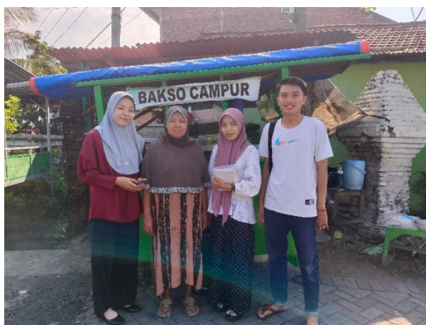
Gambar 1. Dokumentasi Sosialisasi Perizinan Usaha

Keberadaan OSS sebagai salah satu lembaga yang menangani perizinan ternyata belum banyak dikenal oleh masyarakat. Online Single Submission (OSS) merupakan platform yang digunakan oleh usaha, kecil, menengah dan besar untuk mendapatkan lisensi berbasis online (Tarina, 2020). Kebanyakan dari masyarakat hanya mengetahui jika akan mengurus perizinan dilakukan melalui kecamatan dan membawa berkas persyaratan yang diperlukan, tentunya kendala waktu membuat mereka memutuskan untuk belum mendaftarkan legalitas usaha mereka. Setelah dilakukan sosialisasi tersebut bersama pemilik usaha UMKM Bakso Campur, Berikut dokumentasi kegiatan.