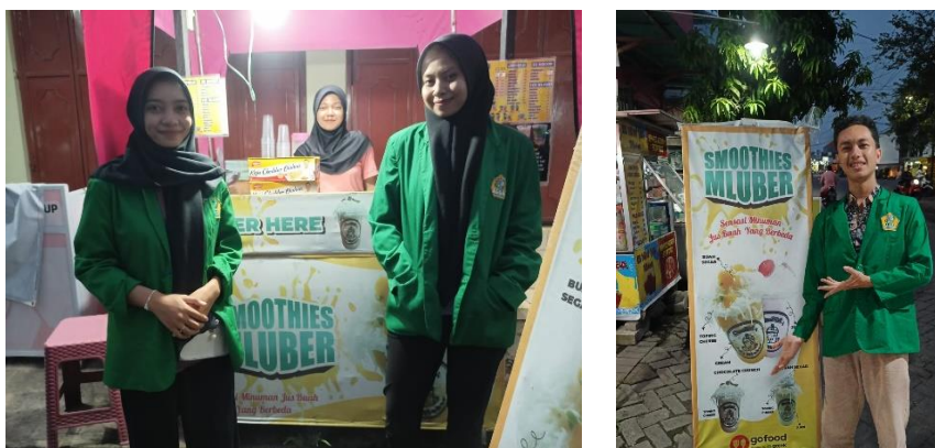
Gambar 1. Sosialisasi dan Wawancara dengan UMKM Smoothies Mluber

Tahapan yang dilakukan setelah survey yaitu melakukan sosialisasi pentingnya mengurus Nomor Induk Berusaha (NIB) melalui Online Single Submission (OSS). Sosialisasi sangat penting karena bila tidak ada sosialisasi maka bisa dipastikan apapun tujuan yang dimaksudkan tidak akan tercapai serta untuk memberikan pengetahuan kepada masyarakat tentang kelebihan dan keunggulan suatu produk atau layanan tertentu. Sosialisasi dilakukan kepada Owner dan salah satu karyawan. Kami menjelaskan bahwa keberadaan Nomor Induk Berusaha (NIB) sangat penting demi menjamin perlindungan hukum UMKM. Perlindungan hukum atas suatu usaha sangat dibutuhkan untuk menjamin keberlangsungan usaha. Oleh karena itu perlu diberikan pemahaman kepada masyarakat, khususnya pelaku UMKM supaya tidak mengabaikan keberadaan Nomor Induk Berusaha (NIB). Dalam pembuatan NIB yang harus disiapkan adalah berkas Nomor Pokok Wajib Pajak (NPWP), Kartu Tanda Penduduk (KTP), alamat email yang aktif dan nomor handphone sebagai persyaratan pendaftaran NIB melalui OSS. Kegiatan Sosialisasi ditutup dengan foto bersama dengan karyawan Smoothies Mluber yang ditunjukkan pada gambar berikut ini.